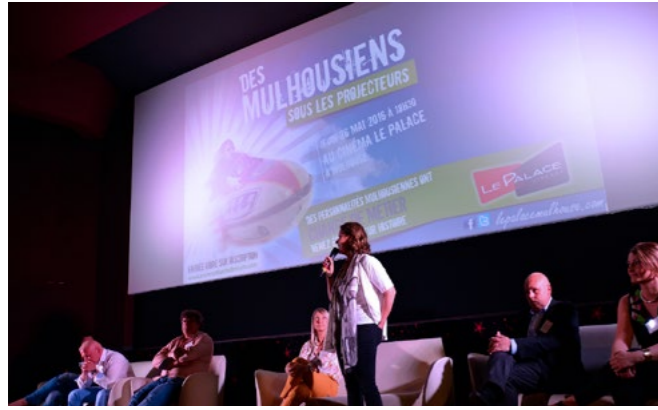
Soirée sur la thématique de la réorientation professionnelle, Cinéma le Palace Mulhouse

grâce à une analyse englobant un ensemble de paramètres (ressources humaines, stratégie, production, commercialisation, ...). Le diagnostic débouche sur une cartographie des compétences du territoire et sur le repérage des métiers en crise, en croissance ou encore en mutation. Le plan d'action va contribuer à sécuriser les parcours professionnels des actifs tout en adaptant les formations aux besoins actuels et futurs des entreprises.